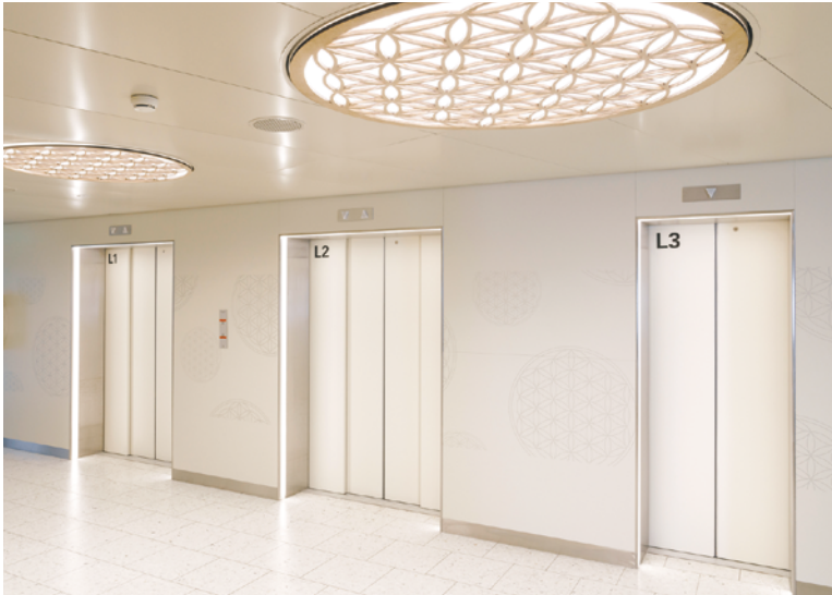
Lift 6. Etage / Ascensore 6° piano