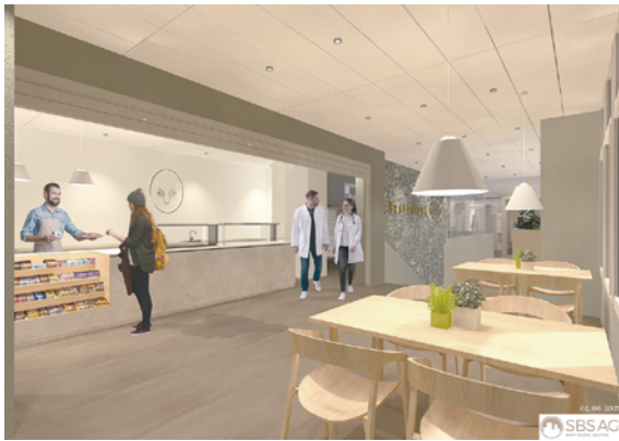
Restaurant / Ristorante