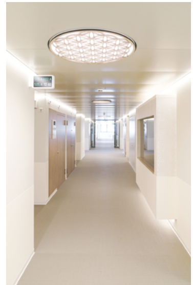
Flur 6. Etage / Corridoio 6° piano