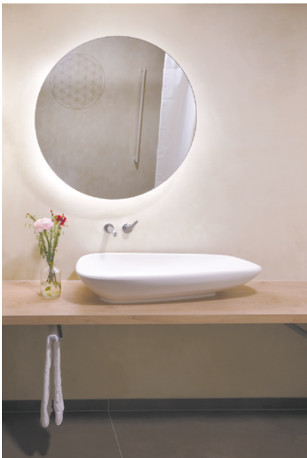
Bad Superior Zimmer / Bagno Camera Superior