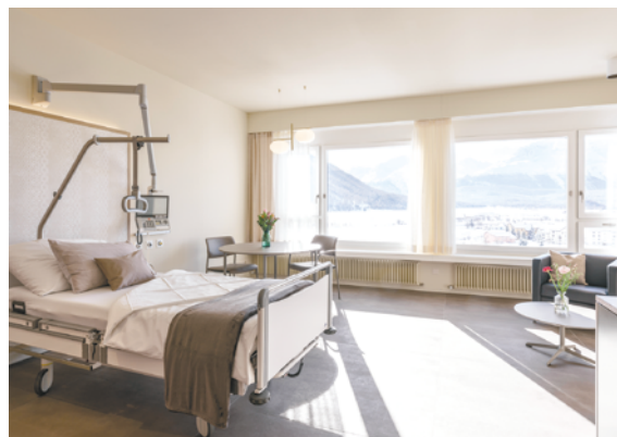
Superior Zimmer / Camera Superior