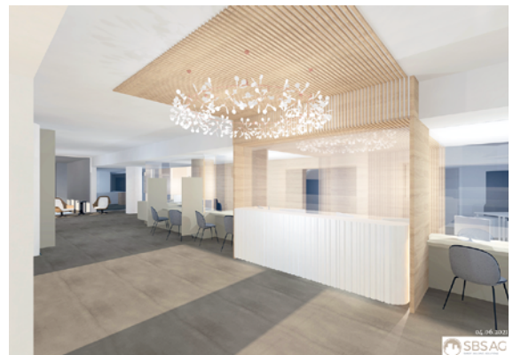
Hauptempfang / Ricezione