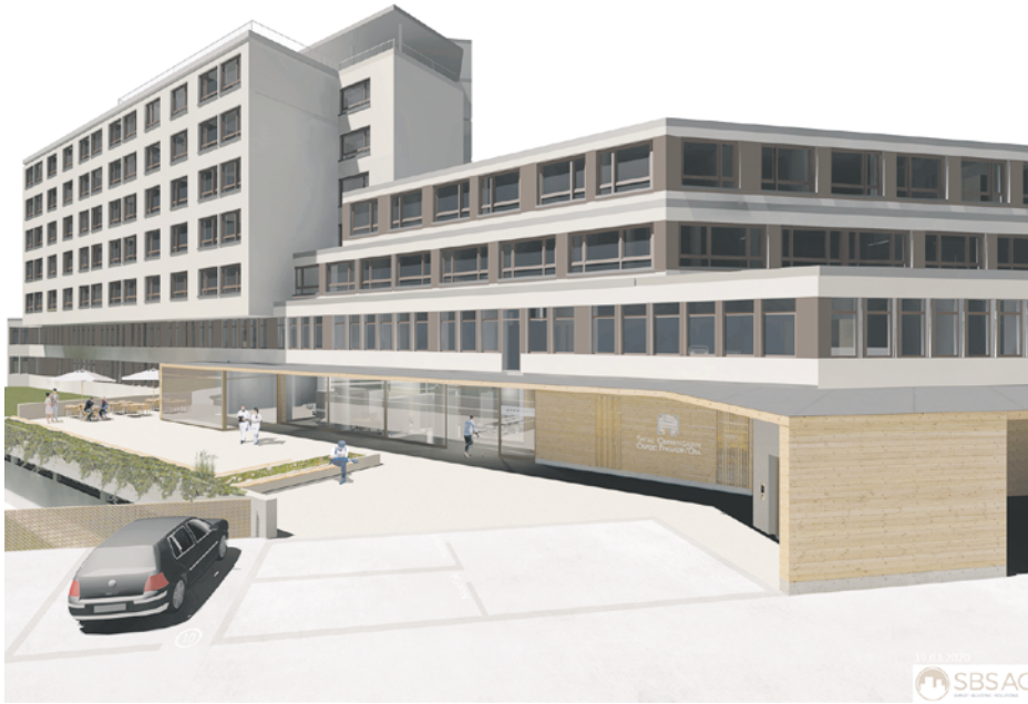
Haupteingang / Ingresso principale